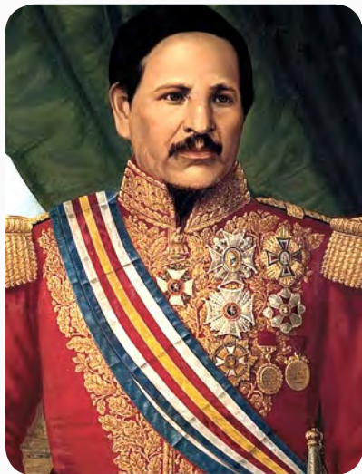
Imagen de Rafael Carrera https://www.biografiasyvidas.com/biografia/c/carrera_rafael.htm

En 1839 se disolvió la República Federal de Centroamérica. En los cinco Estados que la formaban se fueron creando repúblicas independientes, como ocurrió en Guatemala en 1847.