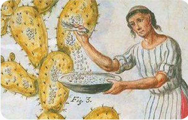
Imagen grana-cochinilla http://www.2000agro.com.mx/analisis/cultivo-de-grana-cochinilla-una-actividad-agroecologica/

Aunque fueron muchos los factores que provocaron la crisis del régimen conservador, no cabe duda de que fue la crisis de la grana-cochinilla, lo que precipitó su caída. El gobierno de Vicente Cerna fue incapaz de encontrarle una solución a la crisis. Esto lo aprovecharon ciertos líderes, como Miguel García Granados, Justo Rufino Barrios, y Los hermanos Cruz. Todos ellos se organizaron con la idea de derrocar al gobierno de Vicente Cerna. Además de tener un discurso contra el gobierno, pasaron a ser un grupo armado, es decir una guerrilla.